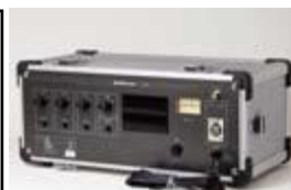
磁気ループアンプ