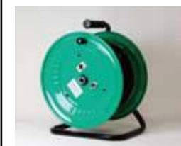
ドラム型 ループアンテナ