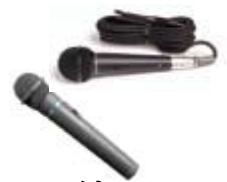
マイク (有線・無線)