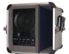
アンプ付スピーカ