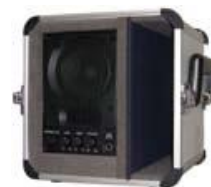
アンプ付スピーカ