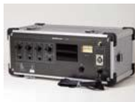
ヒアリングループアンプ