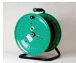
ドラム型 ループアンテナ