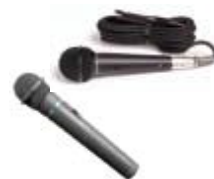
マイク （有線・無線）