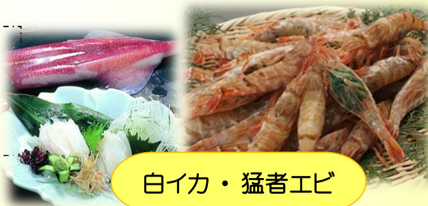
白イカ・猛者エビ

地元でしか味わえない鳥取自慢の幻のエビ！濃厚な甘味とプリプリとした食感！白イカも甘くてコリコリ！旨すぎる夏の最強グルメ！