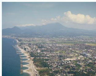
皆生海岸 皆生温泉

弓の形をした弓ヶ浜の皆生海岸にある皆生温泉は全国でも珍しい海中から湧き出る温泉で別名は「塩の湯」。足湯や日帰り入浴施設も多くあり、スポーツ後の疲れを癒すのにオススメ！運が良ければ温泉から大山が見えることも！