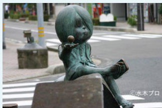
水木しげる記念館 水木しげるロード

境港出身の漫画家・水木しげる氏の代表作『ゲゲゲの鬼太郎』でお馴染みの「鬼太郎」や「目玉おやじ」など、奇妙で愛くるしい177体の妖怪ブロンズ像が立ち並んでいます。妖怪神社や妖怪ショップといった魅力あふれるスポットが目白押し！また、境港市は生の本マグロ水揚げ量日本一！新鮮な海の幸が自慢の食事処もあります。