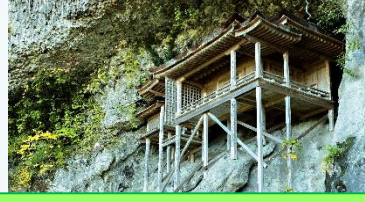
三徳山三佛寺投入堂

江戸、明治期に建てられた建物が多く、今でも当時の面影を見ることができます。国重要伝統的建造物群保存地区に選定されており、玉川に架けられた石橋や、赤瓦に白い漆喰壁が見られる風情のある町並みです。レトロな魅力を感じることができ、また、穏やかな時間がゆっくり流れていくのが感じられます。