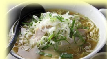
鳥取牛骨ラーメン