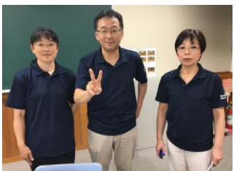
宮内 大瀧 田中 鳥根事務局