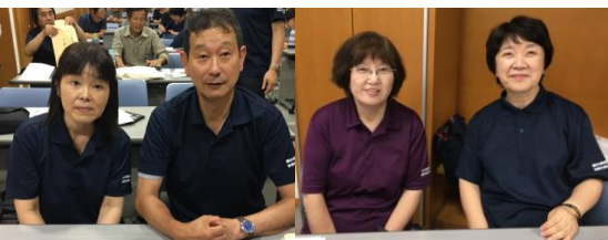
正司 金井 桑谷 三宅 競技運営部 情報保障部