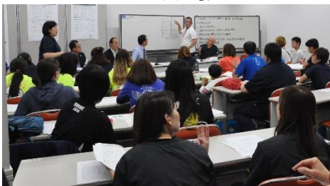
バレーボール競技