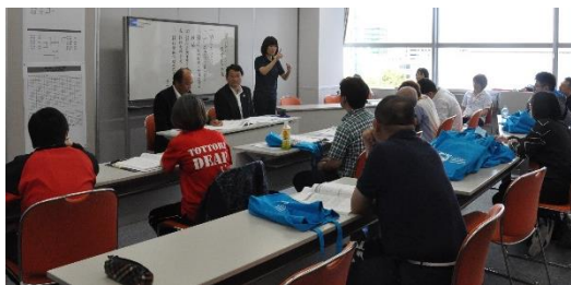
バトミントン競技