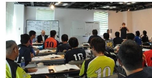
ソフトボール競技