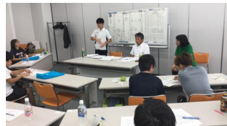
フットサル競技(オープン)