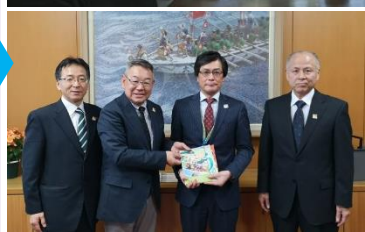
島根県高等学校文化連盟 青少年赤十字会