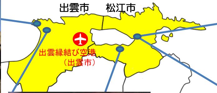
出雲縁結び空港 (出雲市)

「出雲日御碕灯台」は、高さ日本一。360度広がる絶景は「日本の自然百選」の一つで、「日が沈む聖地出雲」としても知られています。