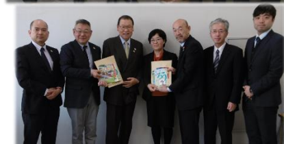
県体育協会・県障がい者スポーツ協会