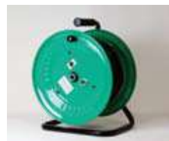
ドラム型 ループアンテナ