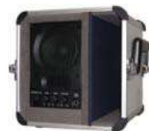
アンプ付スピーカ