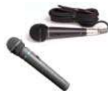
マイク (有線・無線)