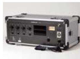
ヒアリングループアンプ